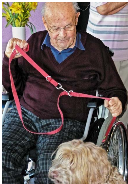
Die Mensch-Tier Beziehung stärkt oft auch das Selbstvertrauen.

► www.tiere-im-heim.ch fachstelle@tiere-im-heim.ch Telefon 043 540 12 38