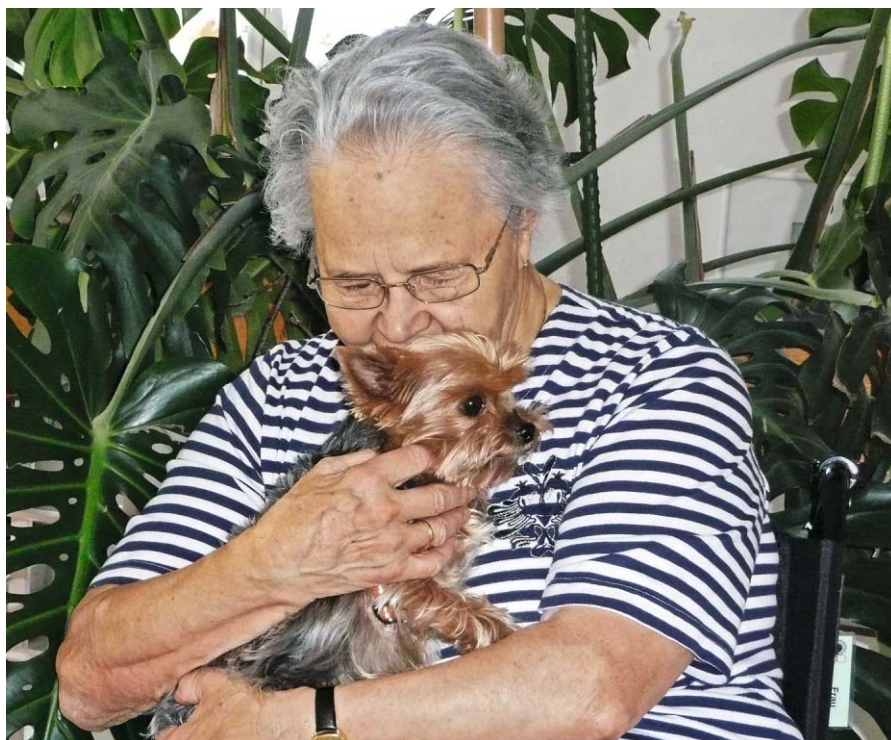
Manch/e HeimbewohnerIn baut zu bestimmten Tieren eine starke Beziehung auf.